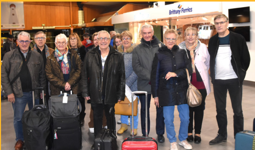
12 membres du comité, en partance pour Newton, gare maritime de Ouistreham, octobre 2023